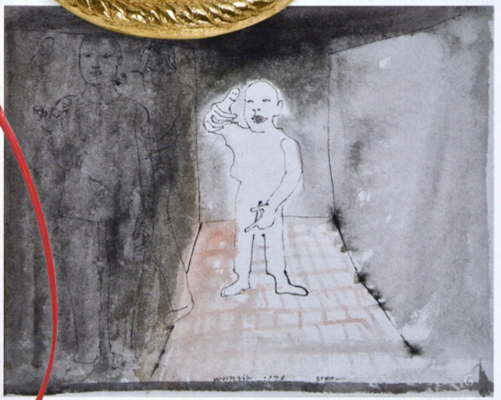
G Co Westerik (1926): Kleine jongen grapjesmakend in de straat, 1978, ges. aquarel, 32 x 40 cm, Kunsthandel Rueb, stand 141